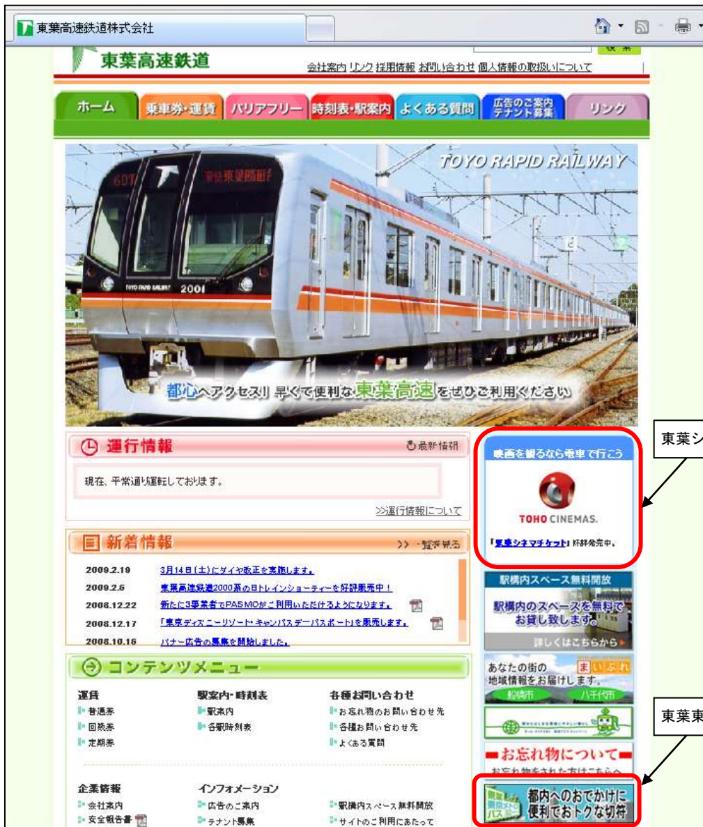
図 6-4 東葉高速線ホームページのトップページ