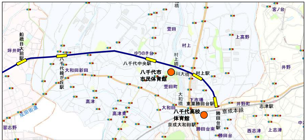
図 6-5 船橋市、八千代市の国体競技会場